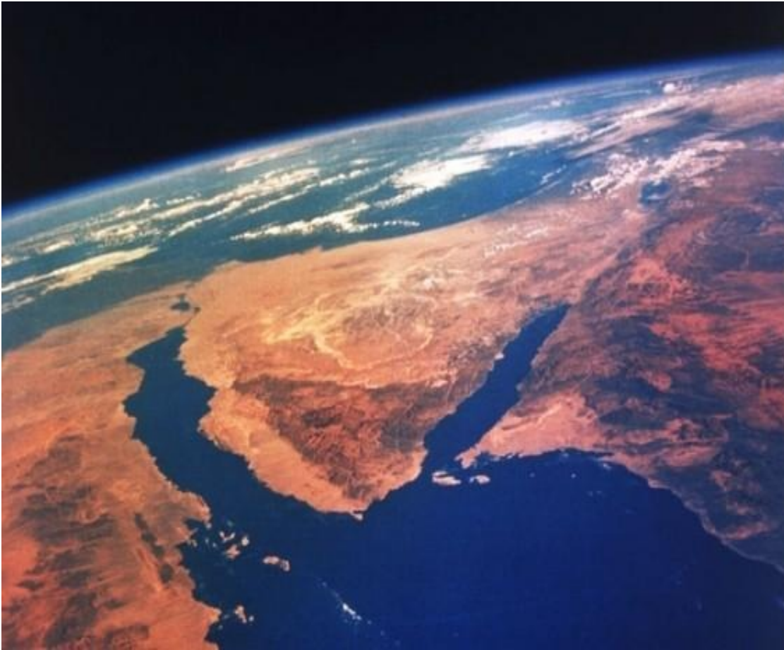
Huella nuclear en la península de Sinaí (Arabia Saudí)

Año 2024 antes de Cristo. Una serie de bombas nucleares arrasan Sumeria. La nube radiactiva mata a la mayoría de los humanos de la zona y obliga a huir a los no humanos; es la guerra de los dioses.