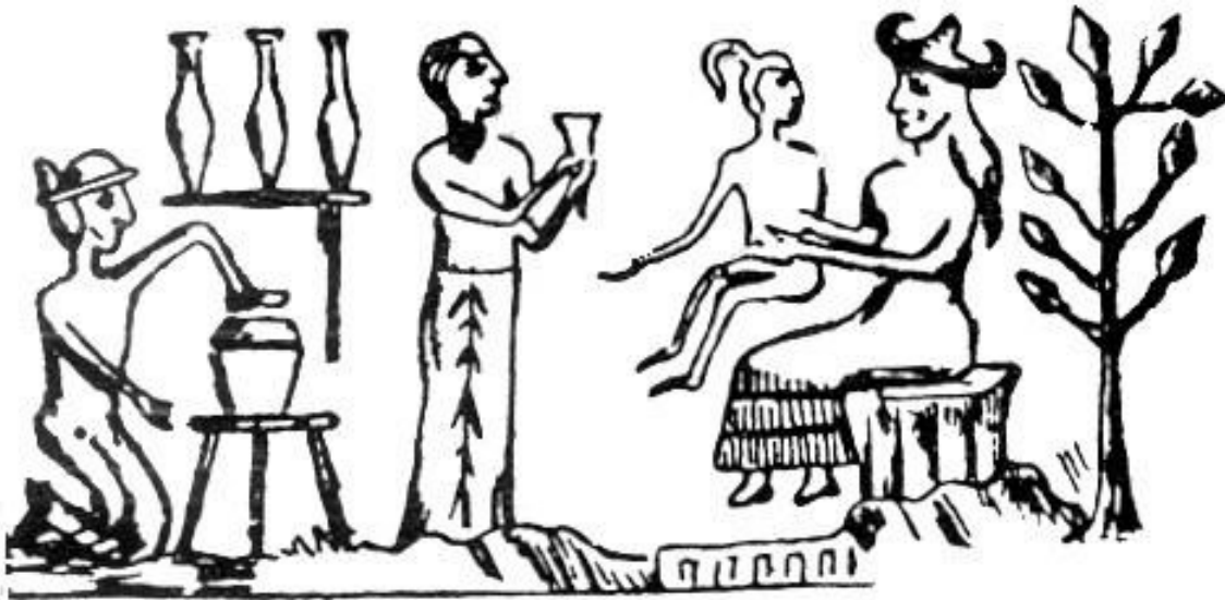
Sello cilíndrico Sumerio (de Sitchin, Z., 1995, Encuentros Divinos, página 13) Thoth, Enki y Ninmah con los primeros Anunnaki/Homo Erectus híbridos

Alrededor de 3800 A.C., los Anunnaki dieron la civilización a los humanos (“la Majestad se bajó del Cielo”) y apareció la primera civilización humana, Sumer en Mesopotamia , la tierra entre dos ríos, hoy Irak. Fue entonces que todo esto fue escrito para la posteridad en lápidas de arcilla que han estado allí desenterradas durante los últimos 150 años.